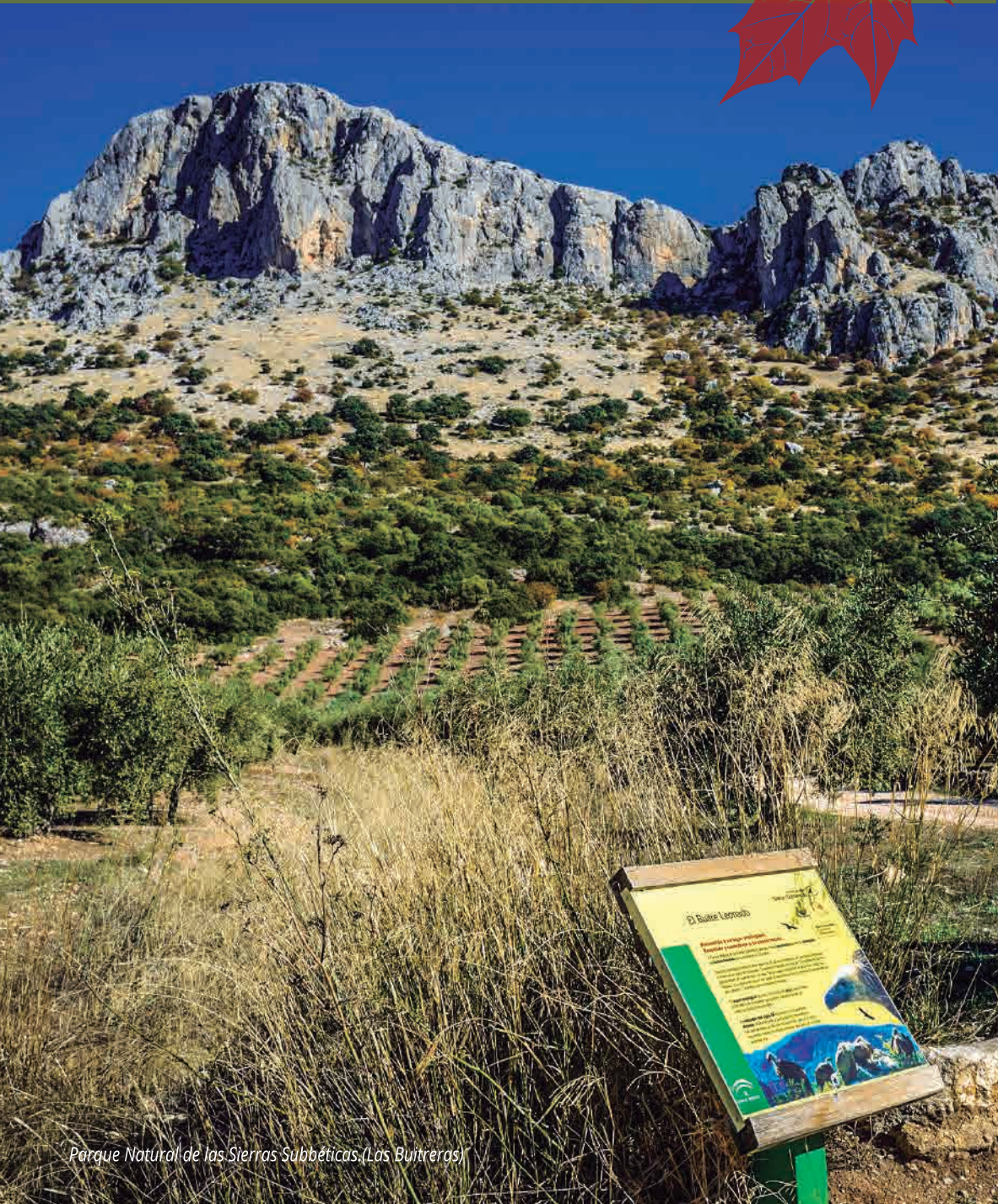
Parque Natural de las Sierras Subbéticas (Las Buitreras)