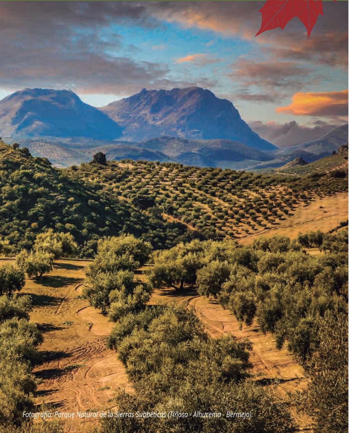
Fotografía: Parque Natural de la Sierras Subbéticas (Tiñosa - Alhucema - Bermejo).