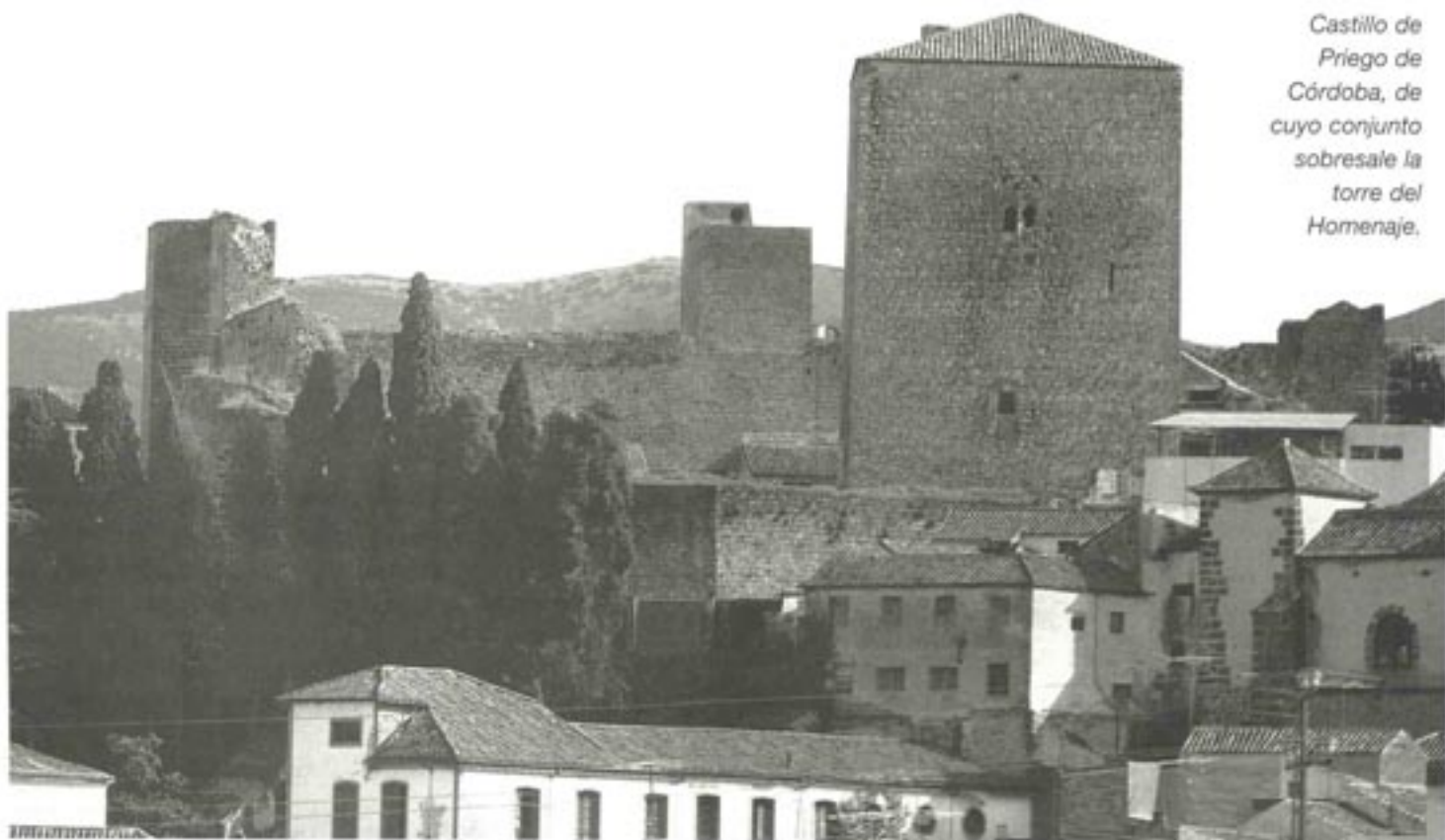
Castillo de Priego de Córdoba, de cuyo conjunto sobresale la torre del Homenaje.

Poco existe en Priego de la etapa renacentista. Algunas muestras en la iglesia y convento de San Francisco, el retablo mayor de la iglesia de la Asunción, y la magnífica talla de Jesús Nazareno, en escultura. La arquitectura de esta época la encontramos en las Carnicerías, erigidas entre 1576 y 1579, y en la Fuente llamada de la Salud, como un digno precedente de lo que se hará en el siglo XVIII bajo el signo del Barroco.