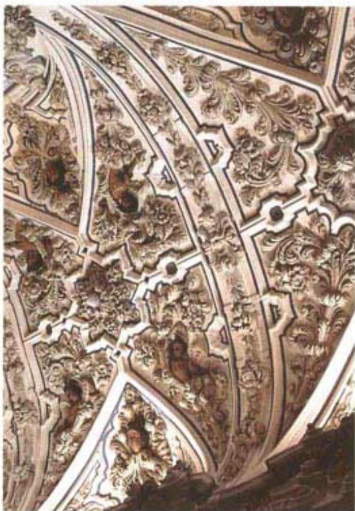
Detalle de la yesería.