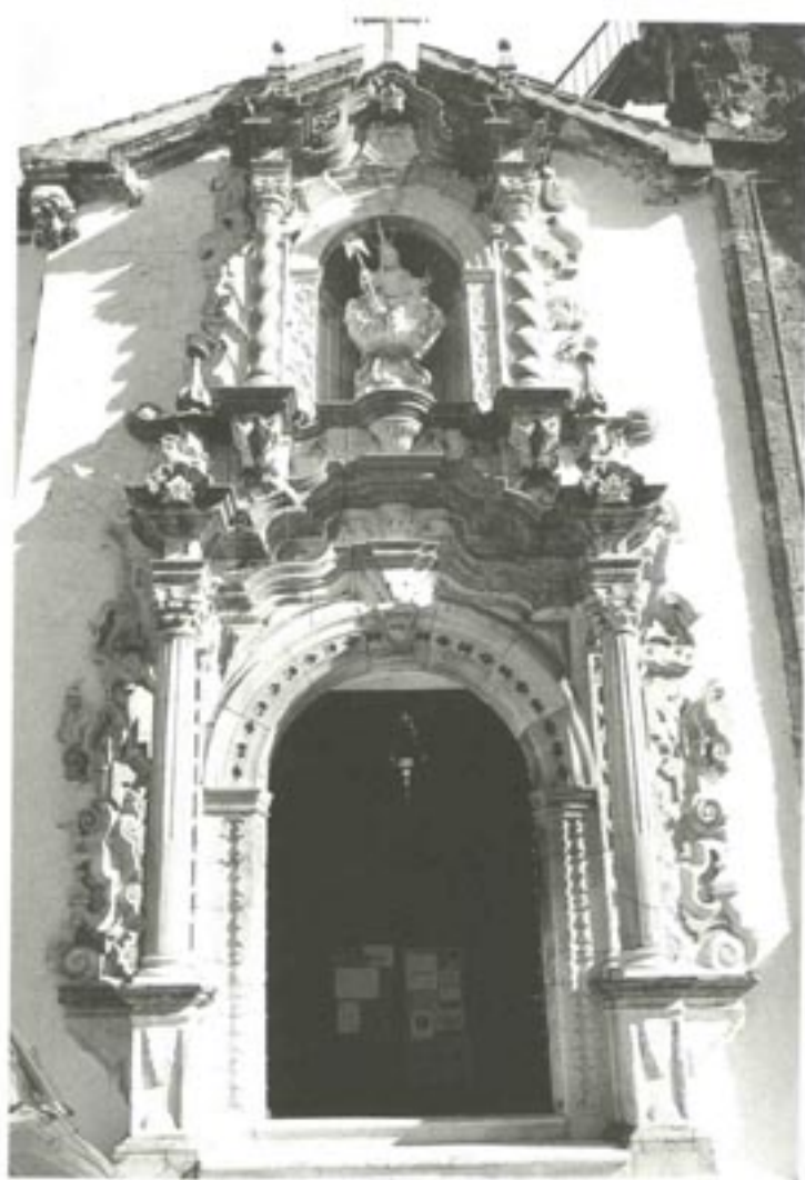
Portada de la ermita de la Aurora.

Te animamos a conocer este bello pueblo que, sin duda, te asombrará por su arte monumental y te sorprenderá por el extraordinario entorno natural de la Subbética cordobesa.