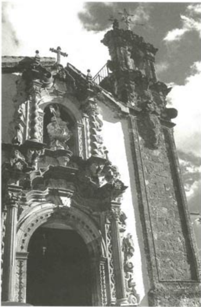
Fachada de la ermita de la Aurora.

El exterior de los monumentos del barroco de Priego son puros volúmenes de sillería, aunque enriquecidos en su silueta por una serie de encrespamientos, angulosidades, y pináculos que rematan las cúpulas, ennobleciendo sus accesos ricos portadas de mármoles que anuncian al exterior las labores de yeso del interior de los edificios, como por ejemplo esta portada de la ermita de la Aurora, que podrás ver en tu visita.