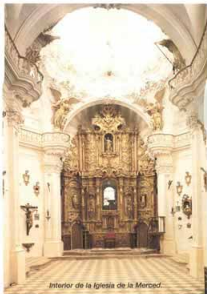
Interior de la Iglesia de la Merced.

Cuando decimos que Priego ofrece el perfil de una ciudad barroca, estamos hablando de la extraordinaria transformación que sufrió en el siglo XVII y fundamentalmente en el XVIII, como consecuencia de una cultura y una mentalidad concreta, apreciable aún en sus monumentales huellas. La cultura barroca es una cultura esencialmente urbana. La ciudad es su teatro de operaciones, bajo el signo de la ostentación y la exuberancia. El hacendado muestra su riqueza y poder en fiestas y artificios, y en las fachadas de sus casas; los regidores de las ciudades construyen grandes edificios utilitarios y fuentes monumentales, y la Iglesia transforma sus sobrios templos con un arte expresionista, con la nueva estética de la exageración, de la sorpresa y del asombro como el mejor instrumento para impresionar al público y moverlo hacia la devoción y el sentimiento religioso.