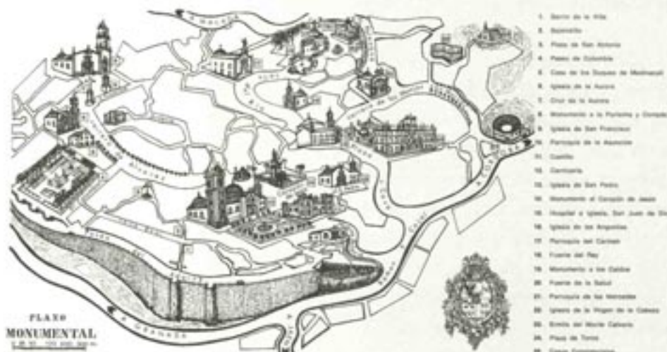
Plano monumental de Priego de Córdoba.

El más remoto que se conserva es el Castillo, con su Torre del Homenaje del siglo XIII y su recinto amurallado del XIV, que testimonian la importancia que tuvo esta población en la Reconquista. También son de la baja Edad Media los restos de la iglesia de Santiago, el primer templo de Priego edificado muy cerca del Castillo. Sus reducidas dimensiones obligarían a la construcción de la iglesia parroquial de la Asunción, que, aunque presente en la actualidad un aspecto barroco, es una obra realizada en un estilo gótico tardío.