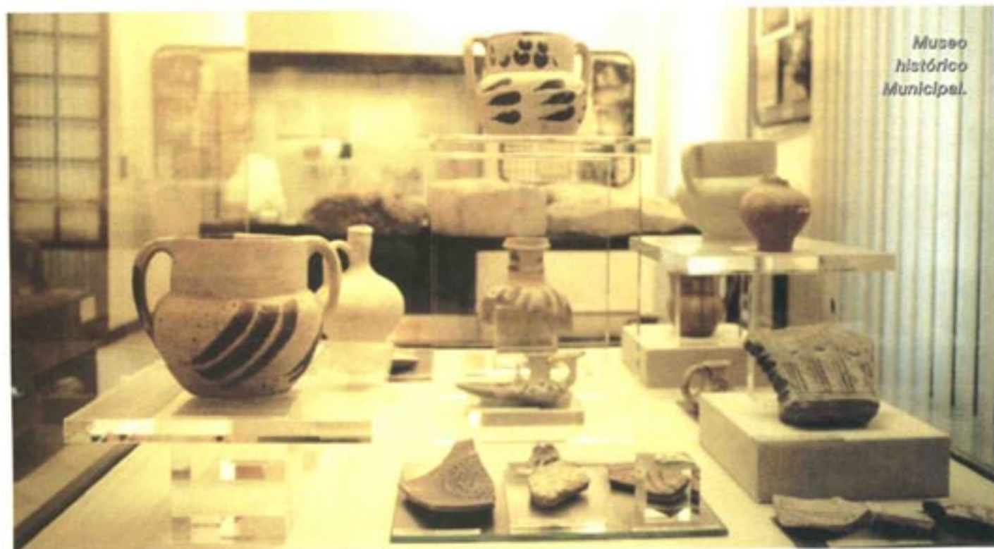
Museo histórico Municipal.

han llegado hasta nuestros días, siendo singulares sus celebraciones de Semana Santa