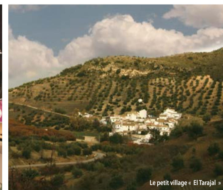
Le petit village « El Tarajal »