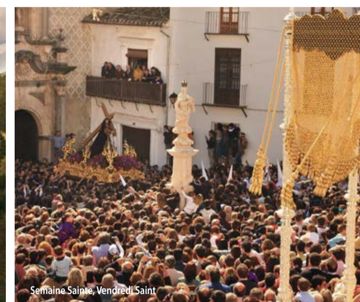
Semaine Sainte, Vendredi-Saint