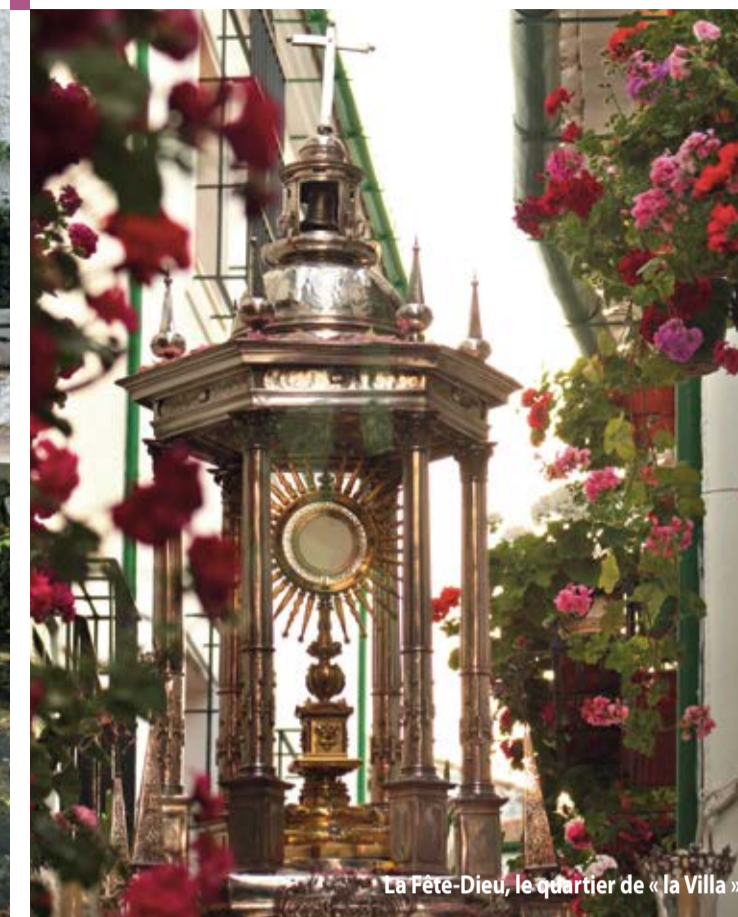
La Fête-Dieu, le quartier de « la Villa ».

Dans ces villages, vous pourrez connaître le charme, le goût par les choses populaires, l'effort pour maintenir les traditions. Un goût de village pittoresque.