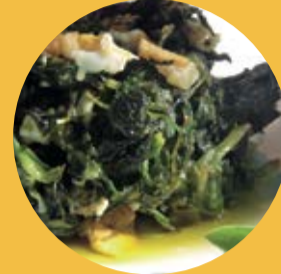
« Revuelto de collejas »