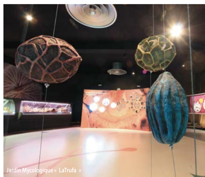
Jardin Mycologique « La Trufa »