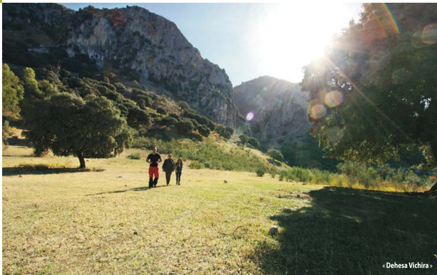
« Dehesa Vichira »

Voyageur, voyageuse, bienvenus. Nous vous remercions de venir visiter notre charmante petite ville et vous invitons à utiliser vos cinq sens pour savourer de délicieuses promenades où vous découvrirez des recoins emplis d'un héritage historique riche et varié ainsi que de nombreux monuments déclarés d'Intérêt National. Laissez vous emporter et contemplez l'art baroque dans sa plus grande splendeur, flânez le long du château, sur le chemin sinueux du quartier musulman de « la Villa ». Ressentez le flux continu des ses sources, l'odeur de ses rues, les murs blancs de ses maisons, la pierre de ses églises ... Et beaucoup plus encore.