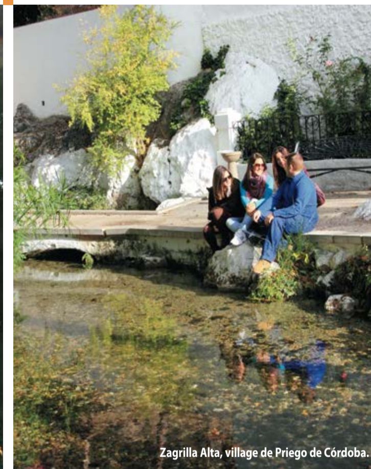
Zagrilla Alta, village de Priego de Córdoba.

Couleur. Terre et air. Soleil et eau. Vallées et massifs, reliefs karstiques, gouffres et grottes. Vous êtes au centre du Parc Naturel et Géoparc des « Sierras Subbéticas » en plein coeur de l'Andalousie.