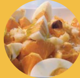
« Remojón de naranja »