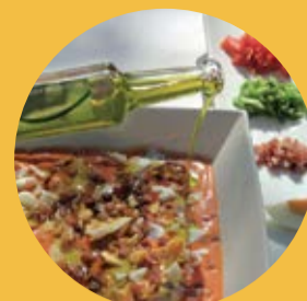
« Salmorejo »