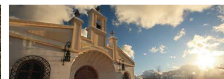
Le ermitage dans le petit village « La Concepción »

Vous y trouverez des gîtes ruraux (autant dans le centre urbain que disséminés dans le paysage) de grande qualité et de caractère, autant pour leur architecture, que pour l'art et la technique de s'adapter aux transformations de l'environnement vital du village.