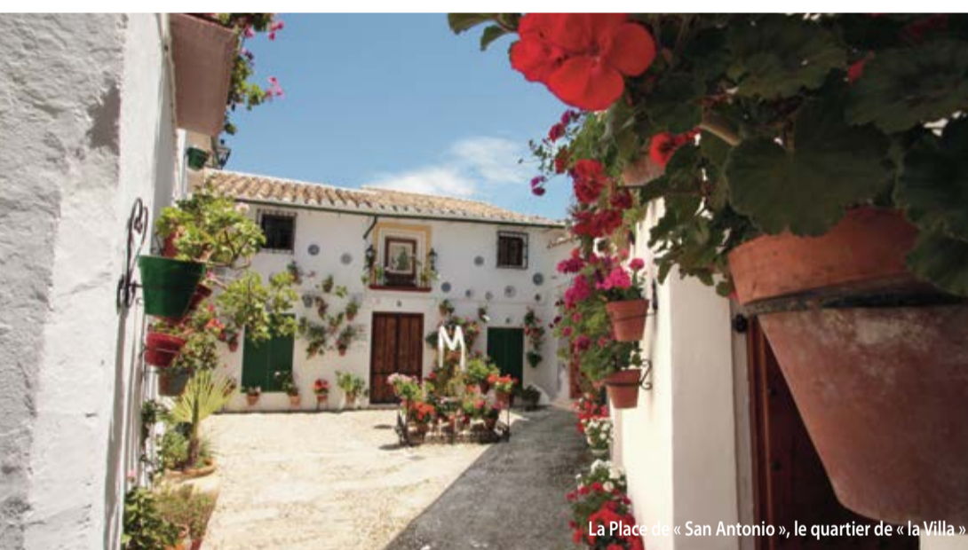
La Place « San Antonio », le quartier de « la Villa »

L'expression d'une forme d'être, de sentir, de vivre. Une culture partagée, savourée, et propagée par un peuple qui s'y connaît en coutumes et traditions.