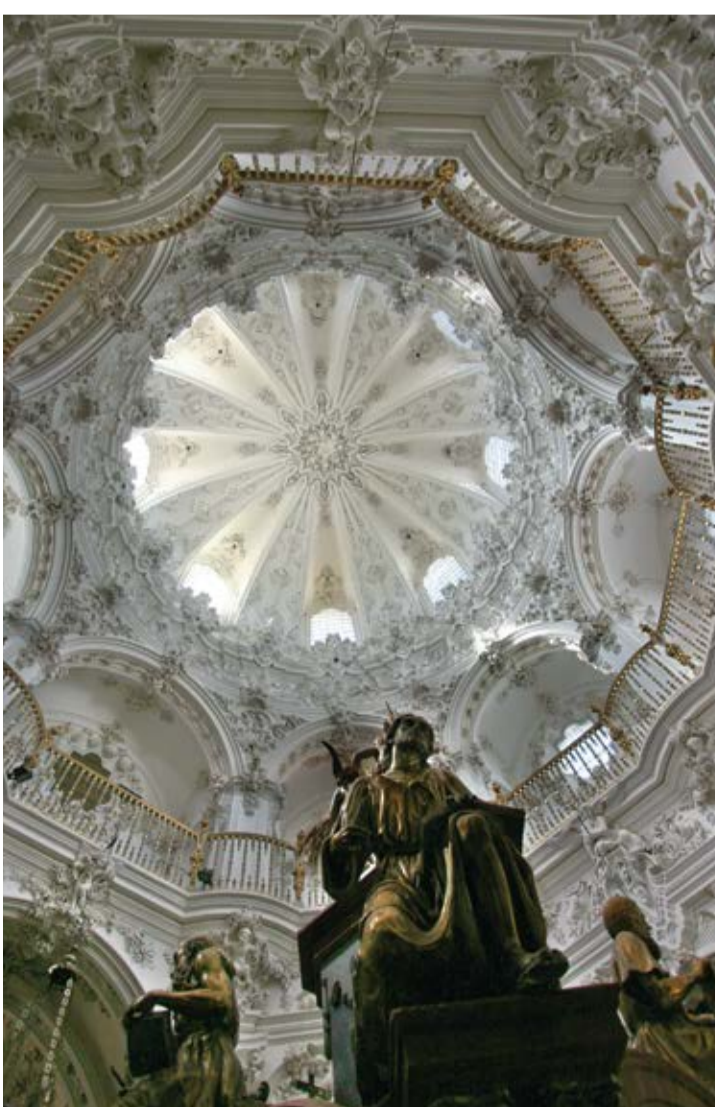
Sanctuaire de « la Asunción »

Elle fut construite par Remigio del Mármol. Elle fut construite par Remigio del Mármol. La décoration est de style baroque mais il y a un début du style néoclassique manifesté sur la façade.