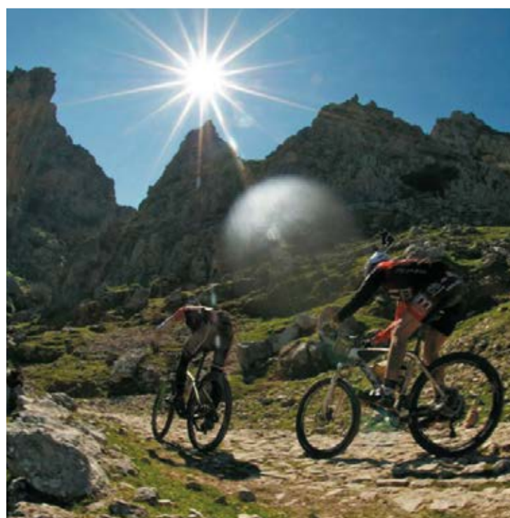
Routes à vélo dans le Parc Naturel

On remarque principalement la Sierra de la Horconera, avec le pic Bermejo (1.476 m) et la cime la plus élevée de la province de Cordoue, le pic de la Tiñosa (1.570 m), formant un massif calcaire impressionnant.