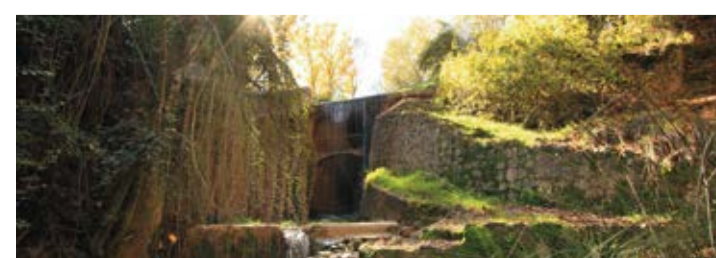
Paysage de la rivière « Genilla »

Mais si vous voulez suivre votre propre rythme, nous mettons à votre disposition toutes les informations nécessaires pour faire des randonnées ou des routes en vélo.