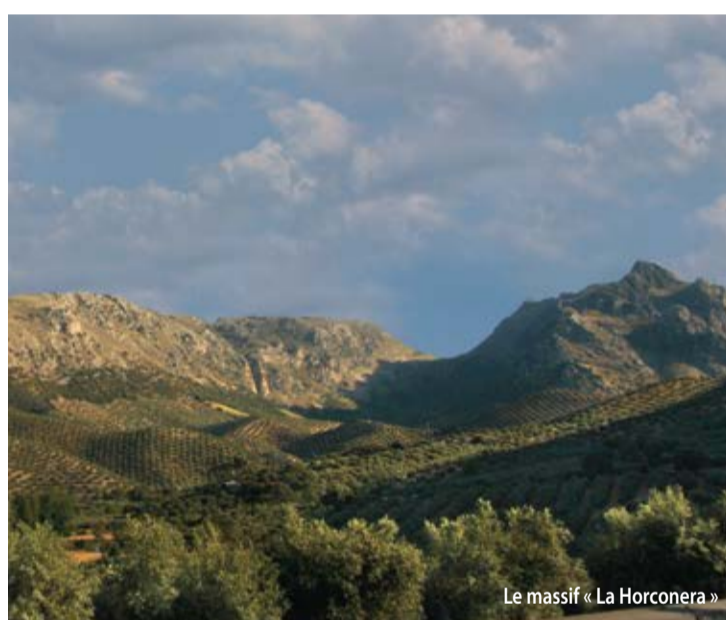
Le massif « La Horconera »