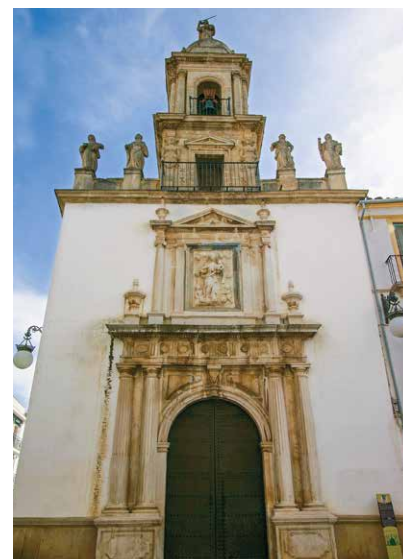
Fassade der Kirche El Carmen