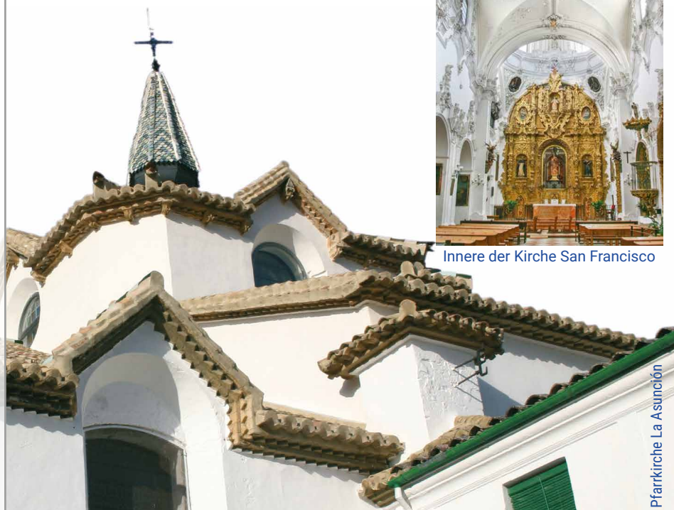
Pfarrkirche La Asunción