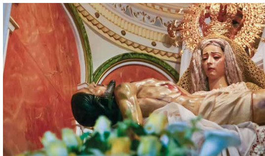
Heiligenfigur der Jungfrau Virgen de las Angustias (Kirche Las Angustias)