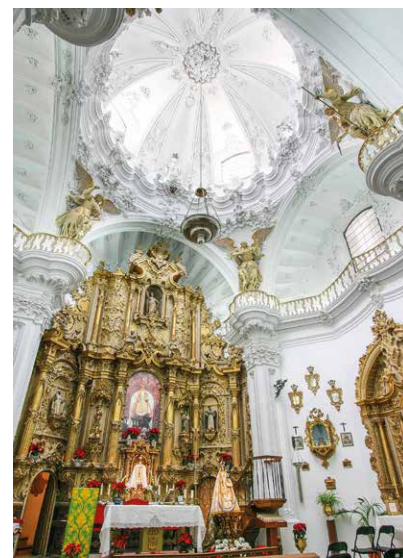
Innere der Kirche Las Mercedes

Ihre Architektur ist typisch für Priego de Córdoba. Das Portal datiert aus 17. Jh. aber es wurde im 18. Jh. wieder aufgebaut. Ihrem Inneren gibt es keine Dekoration; in der Heiligennische steht die Jungfrau mit Heiligem Josef und dem Jesuskind. Es gibt auch eine interessante Sammlung von Ölgemälden aus den 17. und 18. Jh.