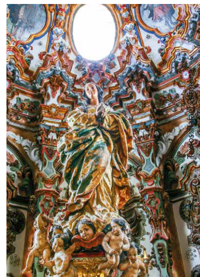
Innere der Kirche San Pedro (Schrein)