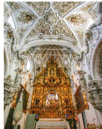
Innere der Kirche La Aurora