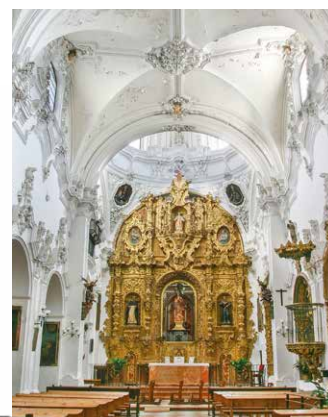
Innere der Kirche San Francisco