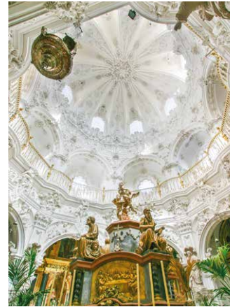
Sanktuarium der Kirche La Asunción